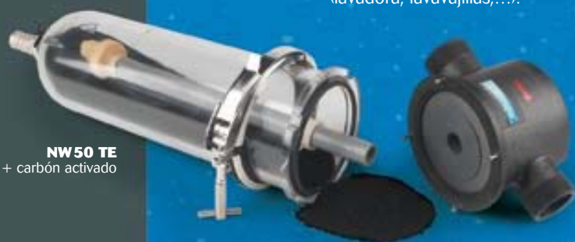
NW 50 TE + carbón activado

El carbón activado CINTROPUR® SCIN elimina los sabores y olores del agua, reduce el cloro y los micro-contaminantes como pesticidas y otras sustancias disueltas.